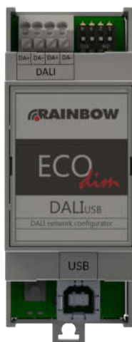
Рисунок 1. Общий вид